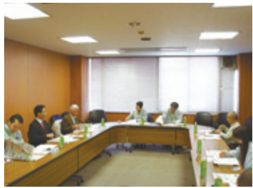
モニター会議の様子

3月15日、平成24年度第2回市民しんぶん南区版モニター会議を南区役所で開催しました。