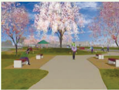
小枝橋公園のイメージ