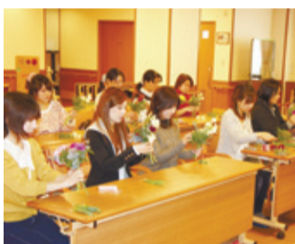
地域交流会の様子

まためられ、上鳥羽の安心・安全のまちづくりに活かされたいと、参加者の方々が宣言集として、上鳥羽の皆さんは多忙な日々にはゆとりを持たせる花の魅力を楽しくもたせて参加者