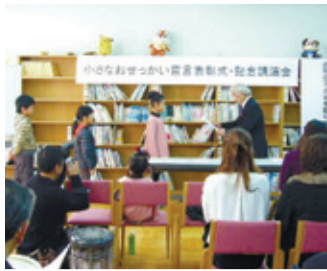
「小さなおせつかい宣言」表彰式の様子

2月23日、あしん・あんぜん上鳥羽推進委員会による「小さなおせつかい宣言」の表彰式が、上鳥羽小学校で開催されました。