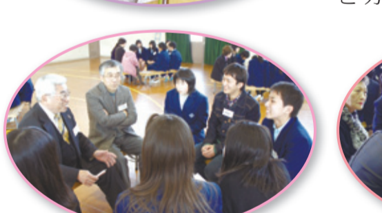
ふれあい(いきいき)ネットワークの様子

今月のぶらり散策は休載します。前回(3/15号)の笠置石の周囲にある大きな石の数は「③ 3」。