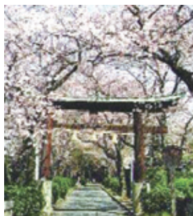
蔵王堂光福寺(参道)