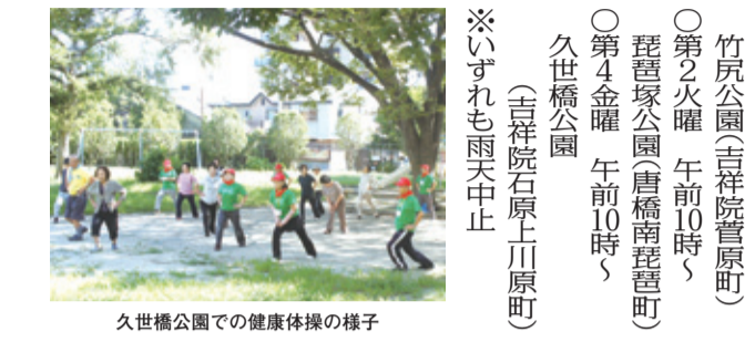
久世橋公園での健康体操の様子

9月28日、南区健康づくりサポーター「みなみず」が、区民の皆さんと運動を行う3つ目の拠点を、久世橋公園で活動を開始しました。当日は夏の暑さが残る晴天の下、25名が参加。参加者の皆さんは音楽に合わせて体操で汗をかくとともに、運動を通じて交流を深めていました。