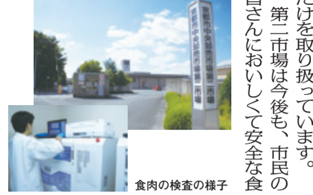
食肉の検査の様子

日時 11月18日(日) 午前11時～午後2時 場所 市中央卸売市場第二市場(南区吉祥院石原東二丁目) 内容 和牛肉・豚肉等の試食・販売、畜産加工品・農産特産品の販売など ※会場には公共交通機関をご利用ください。 ◆バス(42号、84号系統など)「吉祥院池田町」から南へ徒歩3分