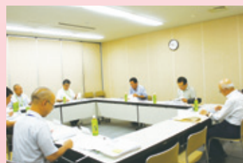
「みなみ力で頑張る! 区民応援事業」審査会の様子(7月30日開催)

現代アートを通じて、みなみ力による南区の新たなまちづくりのきっかけになることを目指して、京都市立芸術大学などの学生とイオンモールKYOTOが連携して、小・中学生などを対象としたワークショップやホテルアンテルーム京都での展示会などを開催。区民の皆さんが芸術作品や芸術家と触れ合う機会を創出する活動を行います。