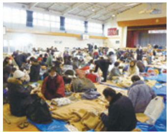
東日本大震災での避難所の様子

今年度は地域住民の皆さんと、区役所や消防署が協働で、発災初期段階での避難所の開設・運営をテーマにした体験型研修を区内3会場を実施。地域防災力の更なる向上を目指します。