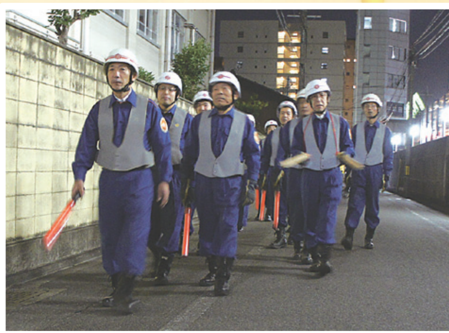
消防団の巡回パトロール

今年も残すところあとわずか。年の瀬を迎えるこの時期は空気が乾燥し、暖房器具の使用も増えるため、火災が発生しやすくなります。今年は節電に配慮して、石油ストーブの利用が増えると見込まれており、特に注意が必要です。