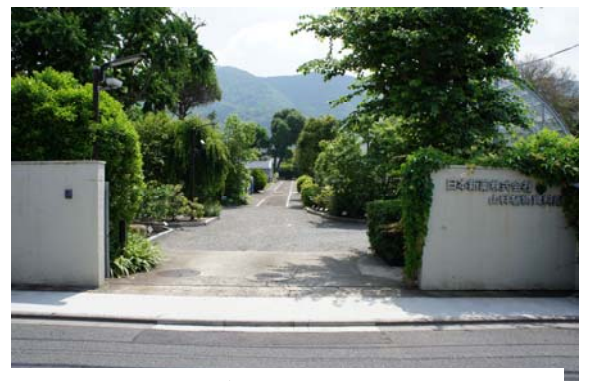
「山科植物資料館」 正面入口

地下鉄烏丸線「京都駅」→「烏丸御池駅」東西線乗換え →「栂辻駅」下車 所要時間：25分程度