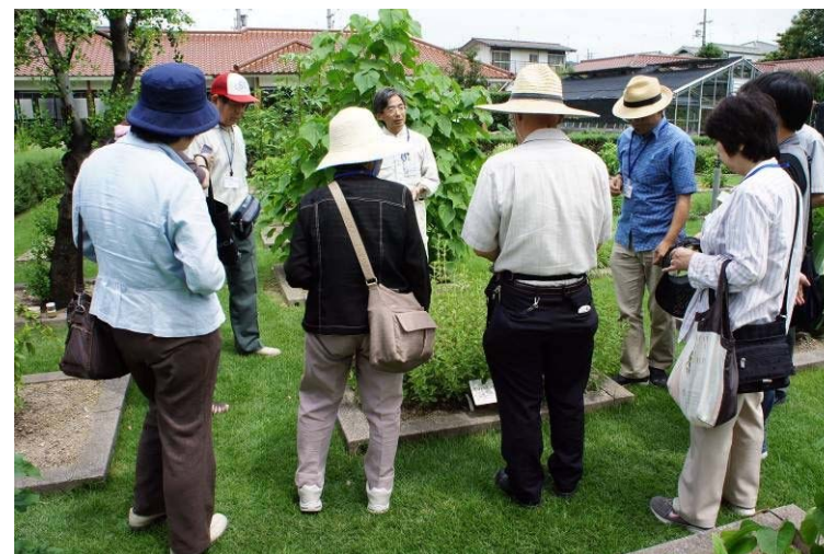
見本園（栽培している薬草などの見学）