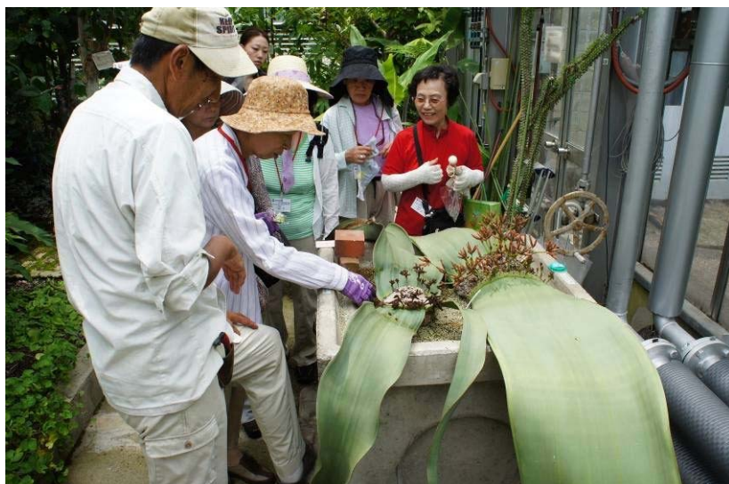
大温室（アフリカ産の植物 キソウテンガイの見学）