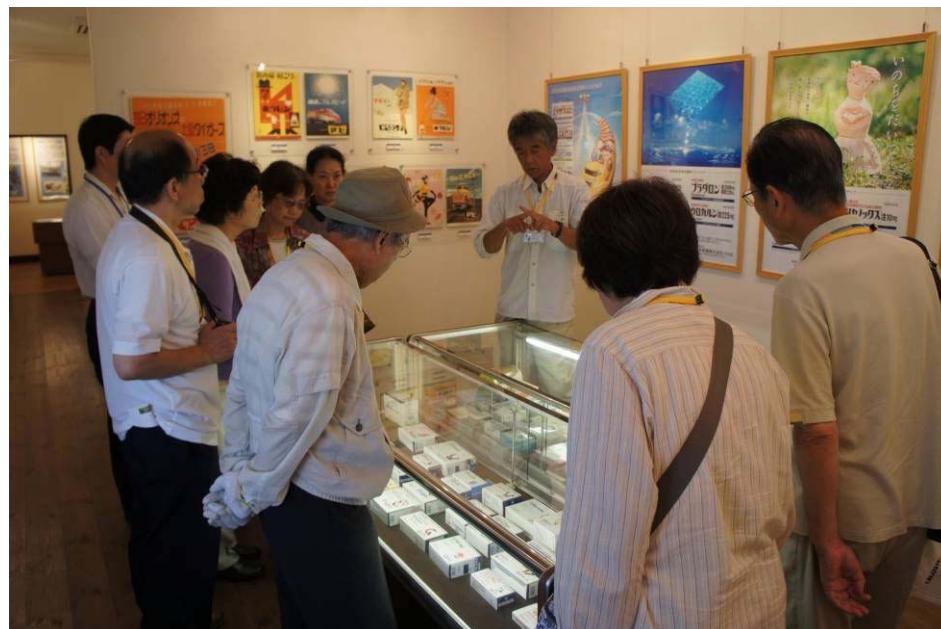
（ミブヨモギ記念館）新・旧の医薬品の展示