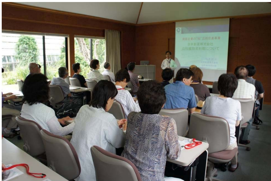
セミナーハウスでの座学（植物資料館の歴史の紹介）