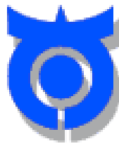
南区シンボルマーク