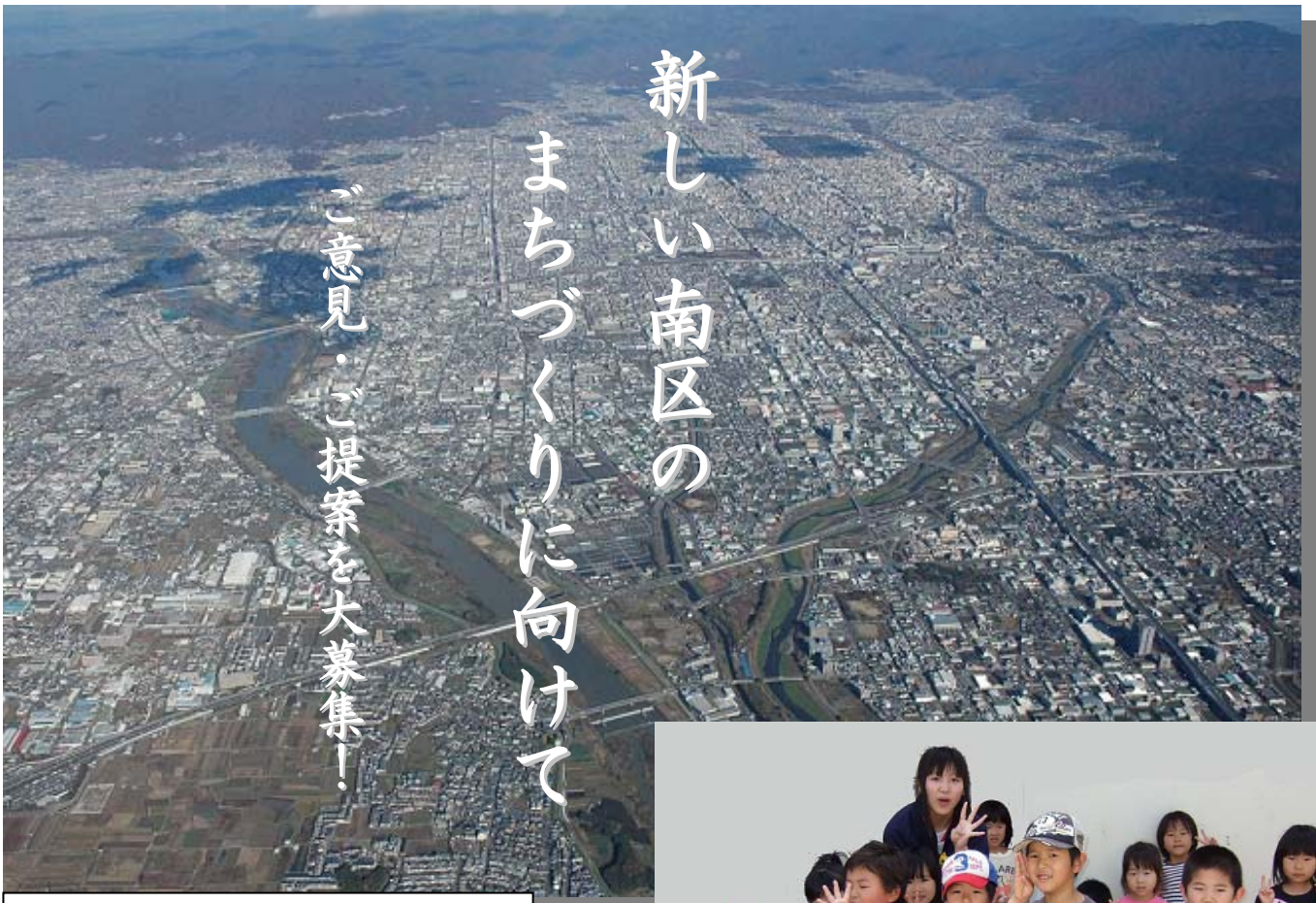
＜南区空撮＞ 市南部地域から北部地域を遠望