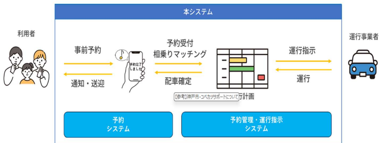
イメージ図（委託契約仕様書より抜粋）