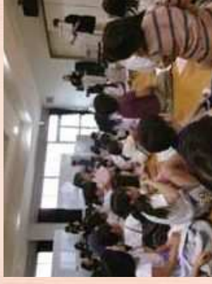
■ 応援団の取組紹介！！ 令和7年度京都市子どもの読書活動優秀実践団体(著)表彰より

PTAや卒業生の保護者、地域の方々などで構成する木いちごの会の皆さんが、京都市立梶原小学校で毎週1回育成学級を中心に読み聞かせ活動を実施。子どもたちの笑顔があふれる時間になっています。