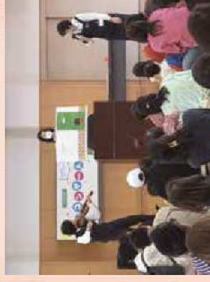
■ 応援団の取組紹介！！ 令和6年度京都市子どもの読書活動優秀実践団体（著）表彰より

京都市立京都堀川音楽高校生と京都市図書館との連携のもと、京都市図書館で乳幼児と保護者向けのミニコンサートと読み聞かせ等を実施。家族で絵本や本に親しむことができ図書館に足を運ぶきっかけになっています。