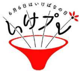
いけばなプレゼンテーションロゴ