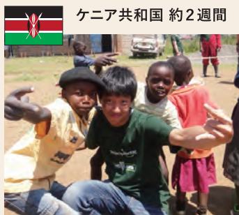
ケニア共和国 約2週間

「伊根の海はゴールドコーストやハワイと同じ位美しい」と話す方に出逢えるなど、日本の文化・景観・礼儀・食などが高く評価されていることを実感しました。この経験を活かして、身の回りや地域にある日本の魅力を見つめ直し、地元を訪れる外国人観光客の方達へ、その魅力を発信するなど「地元から世界に、世界から地元へ」貢献できる人になりたいです。