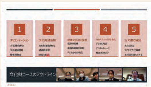
オンライン学習の様子