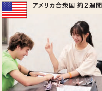
アメリカ合衆国 約2週間

「日本文化は、海外の人達にどのように映っているのだろうか」とこの問いの答えを探しに、フロリダにある日本文化博物館のボランティアに参加し、現地の子ども達への折り紙教室の開催や、スタッフの方への取材に挑戦しました。