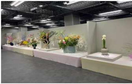
昨年（第76回華道京展）の様子