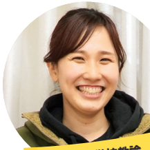
総合支援学校教諭

総合支援学校では、令和6年度から北総合支援学校中央分校が開校するなど、児童生徒数の増加に対応しながら、一人一人のニーズに応じた「個別の包括支援プラン」を活用したきめ細かな教育を推進しています。また、「育（はぐくみ）支援センター」を全ての総合支援学校に開設し、障害のある子ども・保護者への教育相談や就学前の早期相談等のサポートも行っています。