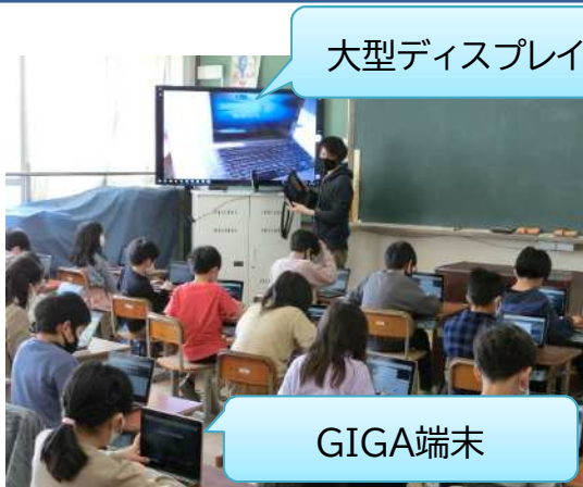
大型ディスプレイ