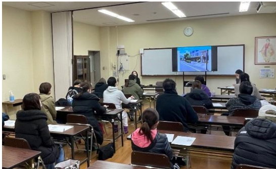
(東総合での説明会の様子)

2月下旬、北総合・東総合の両校に在籍されている中央分校の通学区域にお住まいの保護者の方々を対象に説明会を実施し、施設や教育活動の概要などについてご説明しました。学校行事や学習内容に関することなど、質疑応答の時間にいただいた様々なご意見やアンケートの内容を一つ一つ丁寧に検討させていただきながら、よりよい学校づくりに向けた準備を進めてまいります。