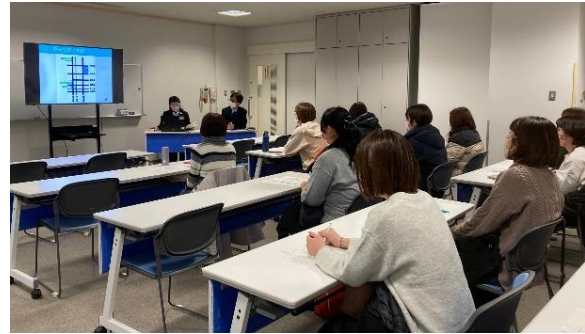
(北総合での説明会の様子)