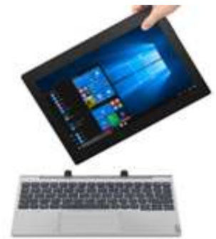
ぎ が たんまつ GIGA端末のイメージ