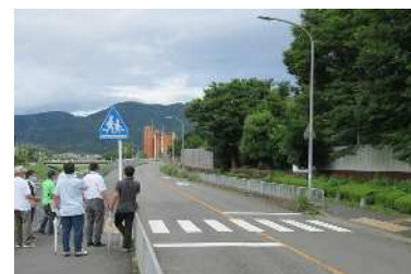
通学路安全実地調査の様子