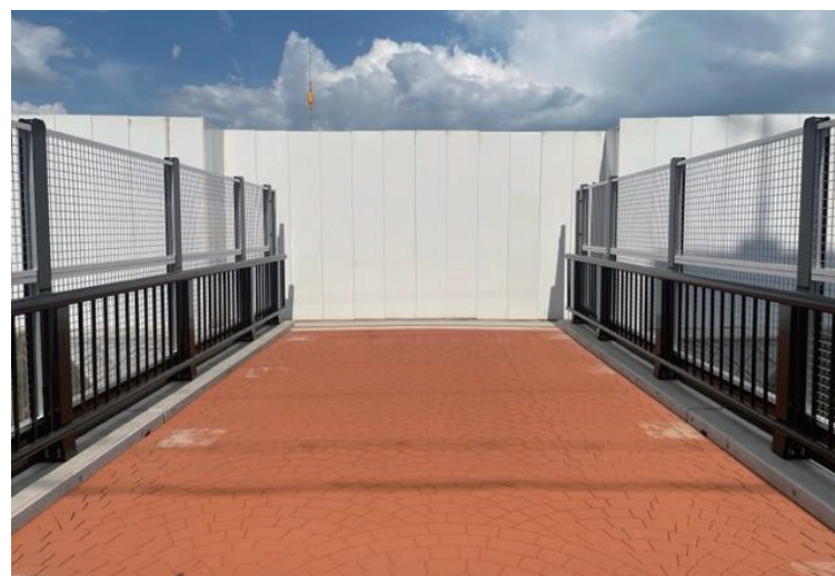
新校舎敷地西側の橋の様子