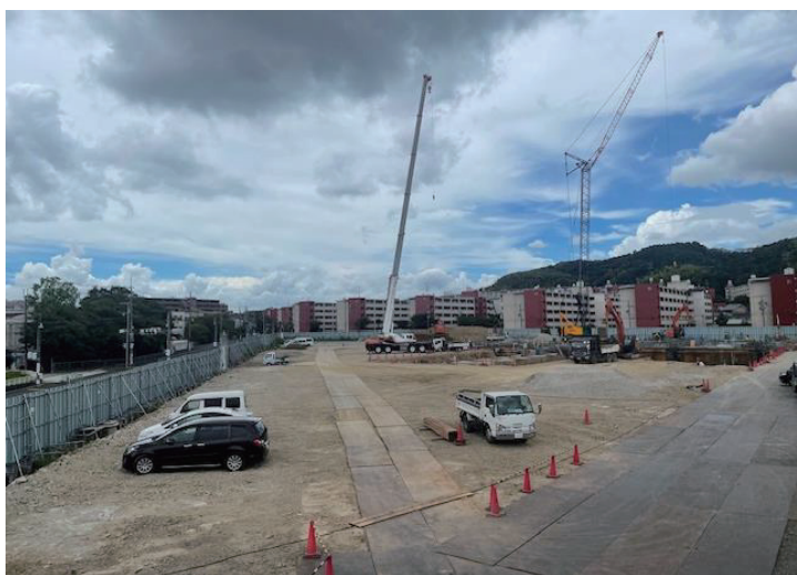
新校舎建設工事の様子（8月下旬）

新校舎敷地の西側の橋の架け替え工事が完了しました。栄桜小中学校開校後、多くの子どもたちが利用しても安全な橋となりました。地域住民の皆様には工事期間中、道路の通行止めなど長らくご迷惑をおかけしましたが、ご理解・ご協力をいただき、ありがとうございました。