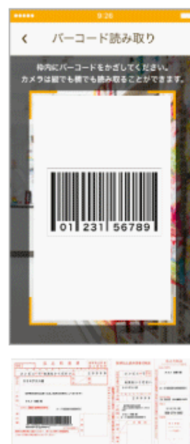
スマートフォンのカメラで バーコード読み取り