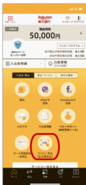
アプリメニューを選択