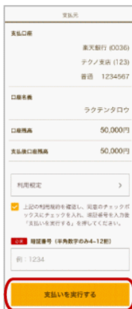
支払い内容を確認し お支払いを実行