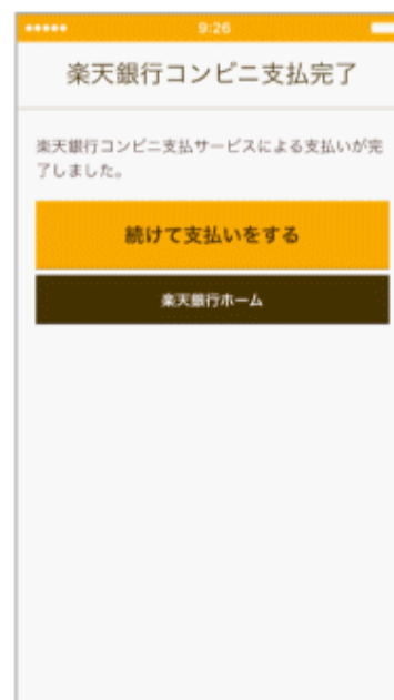
お客様の口座から資金引落