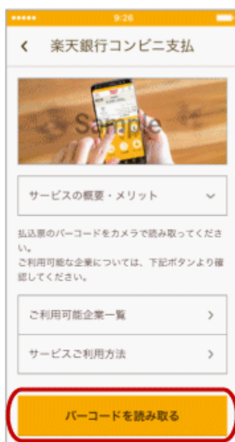
バーコードを読み取る を選択