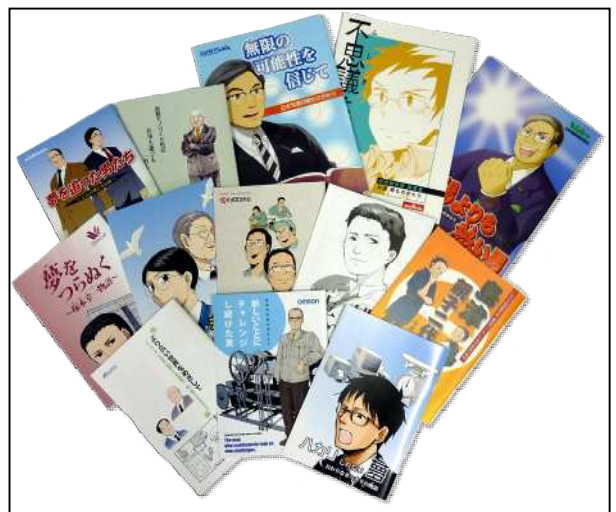
京都モノづくり列伝（伝記マンガ）