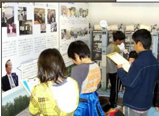
授業での調べ学習の様子