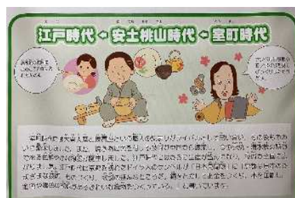
モノづくりの系譜

伝統産業から近代産業、さらには先端技術産業へとつながり発展した京都のモノづくりの変遷と歴史を伝えるパネルを設置しています。