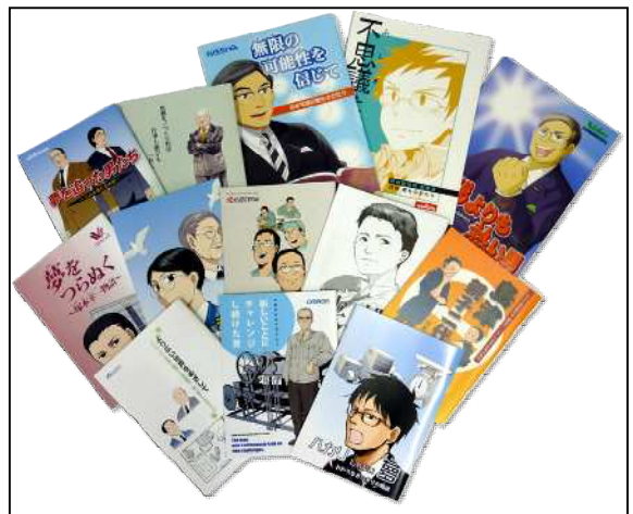
京都モノづくり列伝（伝記マンガ）

主催 京都市教育委員会 問合せ先 京都まなびの街生き方探究館 Tel：075-253-0880, FAX：075-253-0878