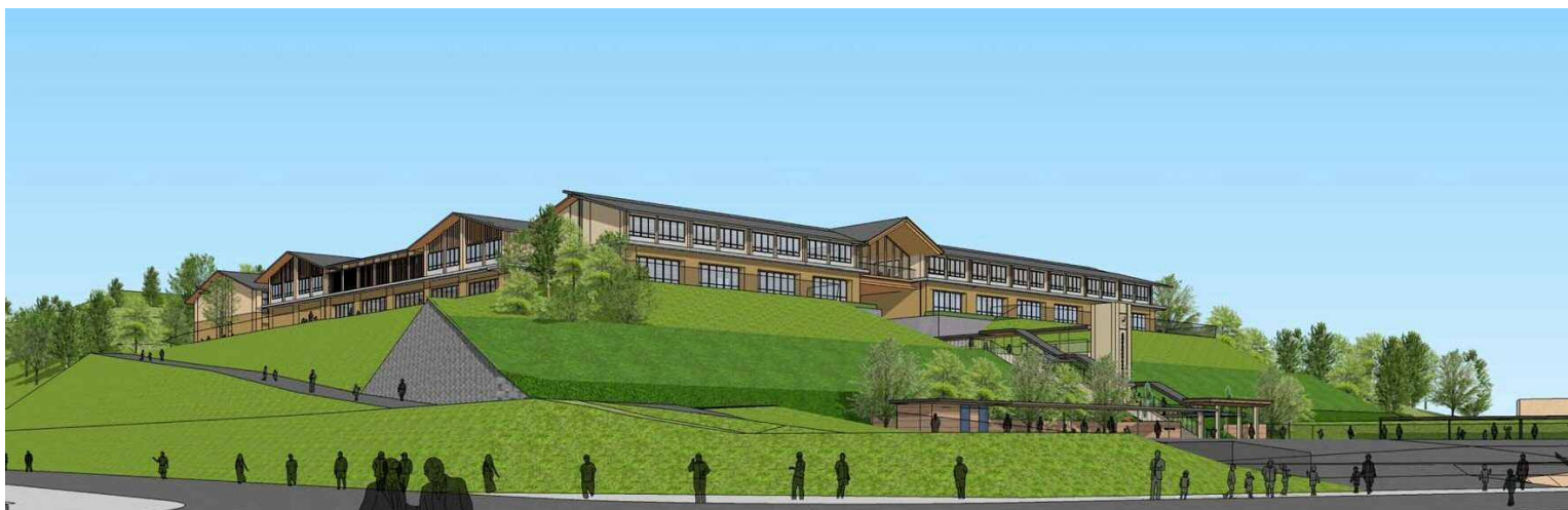
敷地南西角の交差点から見た外観イメージ