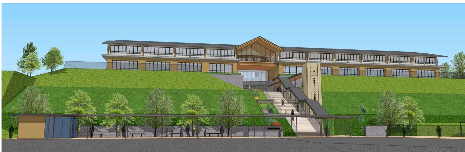
校舎南側玄関口から見た外観イメージ