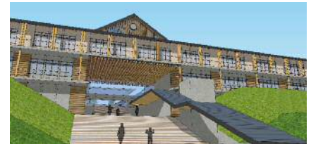
＜校舎南側玄関口の近景イメージ図＞