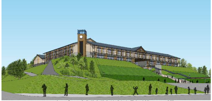
＜ウッディー京北前交差点付近から見た外観イメージ図＞