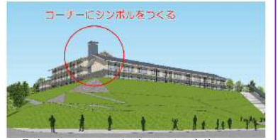
④案 水平ラインを強調したデザインにシンボル性を加えたデザイン