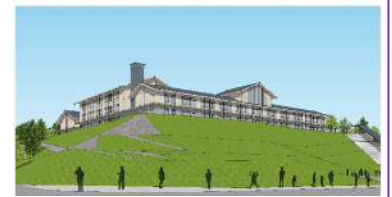
⑥案 ③と④を組み合わせた上で中央のシンボル性を強調したデザイン