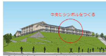
③案 存在感・シンボル性を重視したデザイン