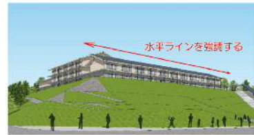
①案 丘と一体となったのびやかな水平ラインを強調したデザイン