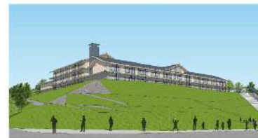
⑤案 ③と④を組み合わせたデザイン