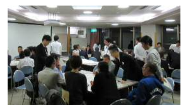
地域や学校の枠を超えた4班編成のもとで熱心に議論