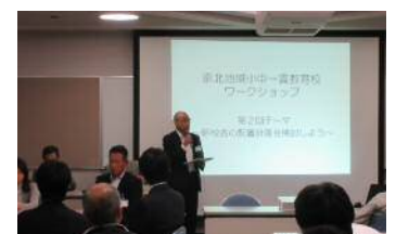
設計担当から全体計画説明