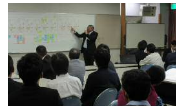
各班から出された意見を発表