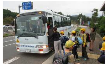
スクールバスへの乗車