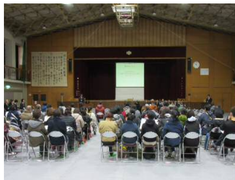
[11月30日(土)周山中学校]