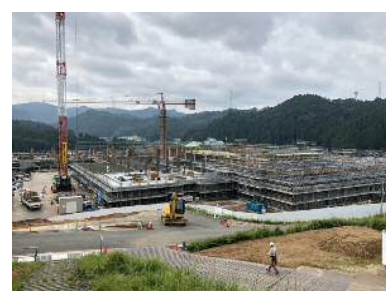
工事現場の様子 (9月下旬)

久保 正鳳 作詞 平田あゆみ 作曲 今さし昇る 日の影に 1 生気あふるる 若き芽よ 大志を抱きたゆみなく 2 真理の道を 究めよう 3 希望の丘に そびえたつ 輝く京都 京北校 みどりの山を 仰ぎつつ 2 清き流れの 大堰川 友と和みて 励み合い 3 自律の力 高めよう 共に磨かん 若人の 進む行く手に 光あれ 3 魁の花 薫りたつ 千古の遺跡 学び舎に 2 尊き歴史 胸に抱き 3 広き世界へ 翔びたとう 1 希望の歌が こだまする 2 伸びゆく 京都 京北校