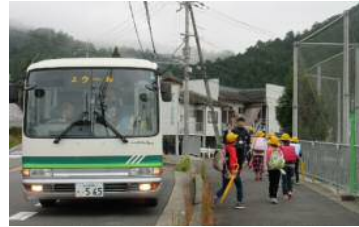
スクールバスから降車