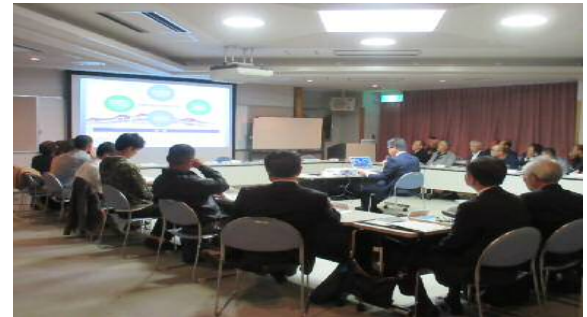
第15回会議の様子 [10月25日（金）京北合同庁舎 大会議室]

会議では、新校の校歌（作曲）の確認及び校章デザインの検討を行い、それぞれ下記に記載のとおり決定しました。また、新校の「教育構想」及び学校説明会の内容、施設整備の進ちょく状況、通学安全の取組について意見交換を行い、「4小中学校PTA代表者会」の取組状況について報告を受けました。