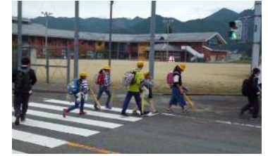
バス下車後、徒歩で帰宅