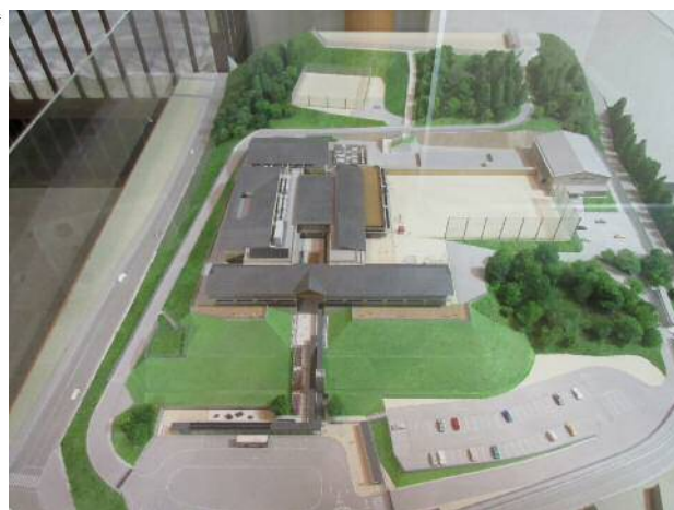
新校舎の完成イメージ模型／京北合同庁舎1階入口付近に展示しています