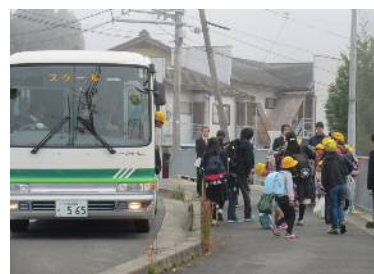
スクールバスからの降車