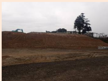
法面・ロータリー造成工事