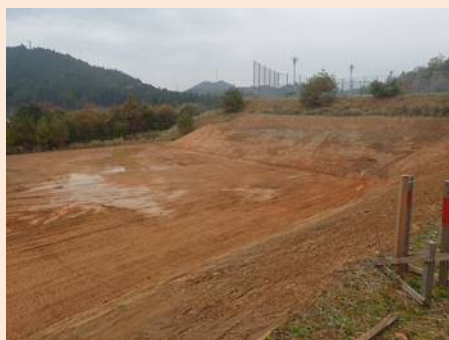
テニスコート造成工事