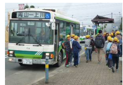
路線バスからの降車

混乱もなく、徒歩通学の児童も全員無事に登校した。また、京北第二小の車両バスの変更や、荷物の持ち方の指導等により、路線バスの混雑はかなり緩和され、概ね定時運行された」との報告がありました。