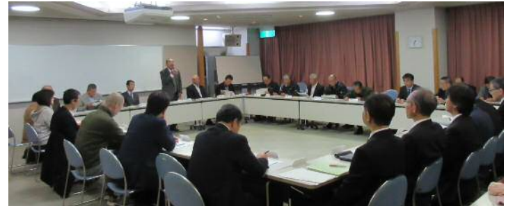
第12回会議の様子 [11月20日（火）・京北合同庁舎 大会議室]

会議では、新校の校名案について協議し、「京都京北」を地元校名案として最終選定するとともに、施設整備の進捗状況や新校舎の概要、通学安全に係る登校シミュレーションの実施結果、並びに新校のPTA組織・規約等について検討を行う「4小中学校PTA会長会」の取組状況について報告がありました。