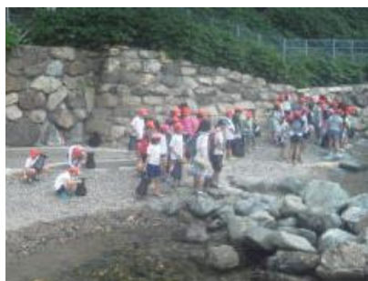
長期宿泊学習<5年生合同> 若狭湾青少年自然の家(7月3日～6日)