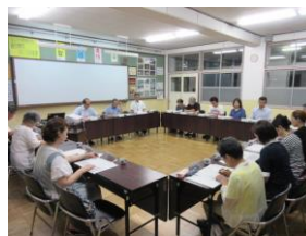
一次統合準備会 (7月28日)

さらに、向島二の丸小では、図書室のリニューアル工事が行われるなど、円滑な一次統合に向けて着実に準備が進められています。