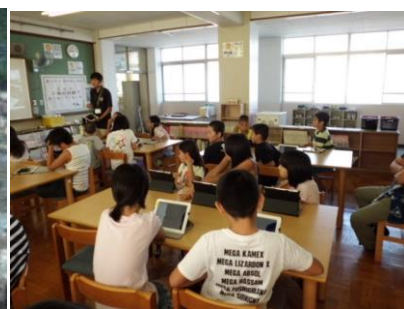
リニューアルされた 向島二の丸小の図書館