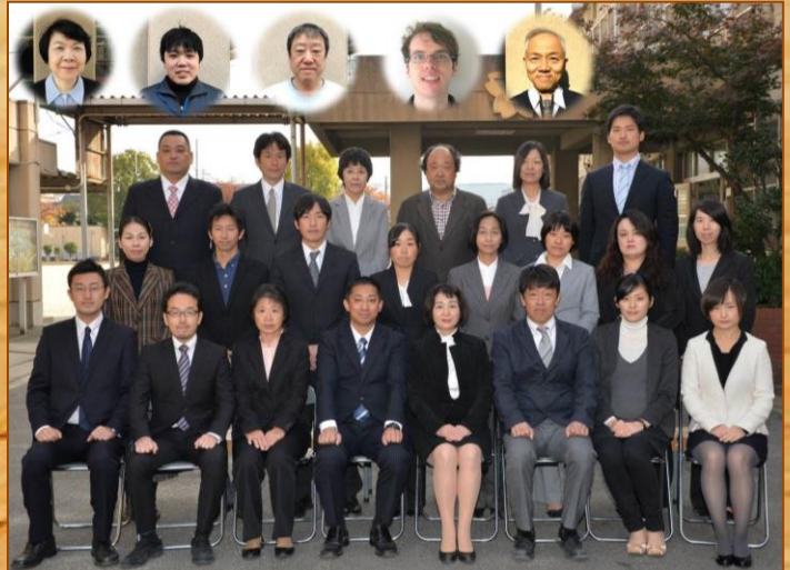
九条弘道小学校 学力向上チーム