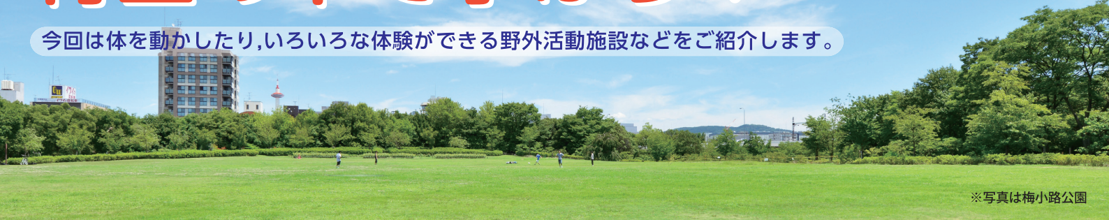
※写真は梅小路公園