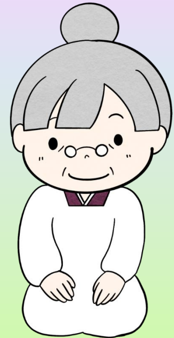
みやこおばあちゃん