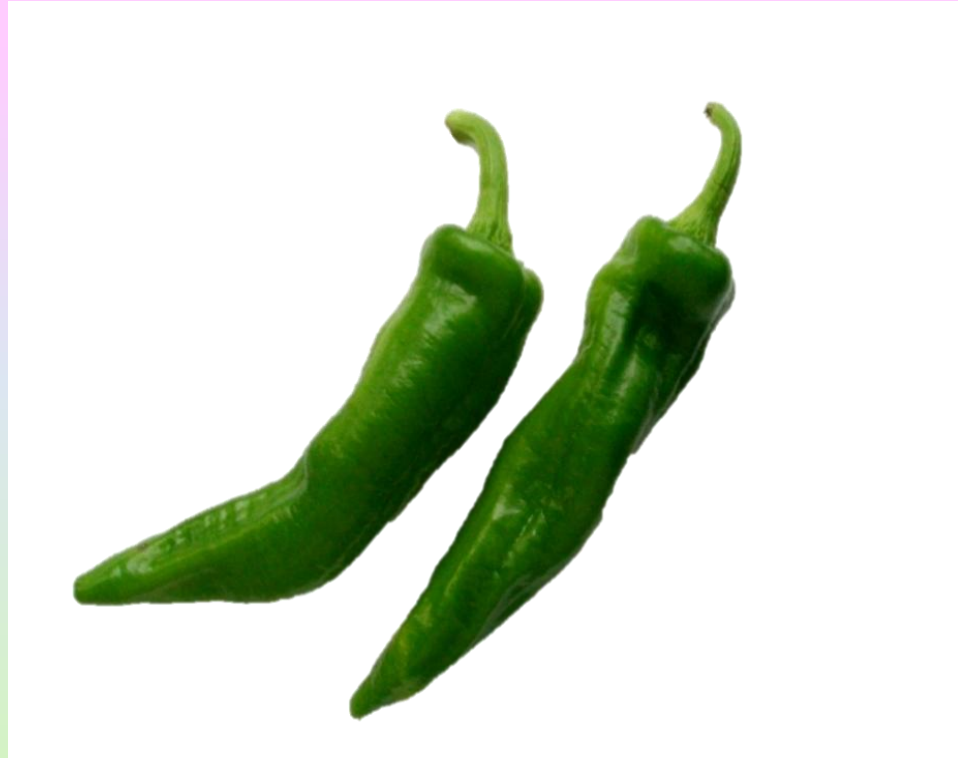
まん がん じ 万願寺とうがらし