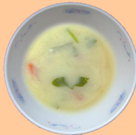
きょうふうみそしる