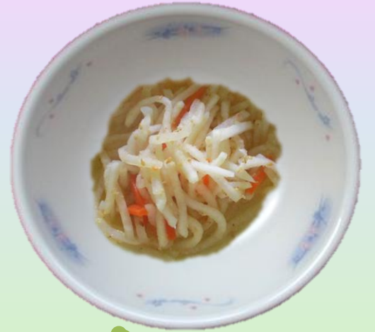
こうはく 紅白なます