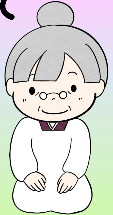
みやこおばあちゃん