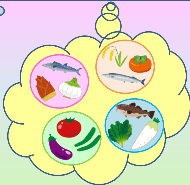
き 季節感と旬の しゅん 食べ物 た もの