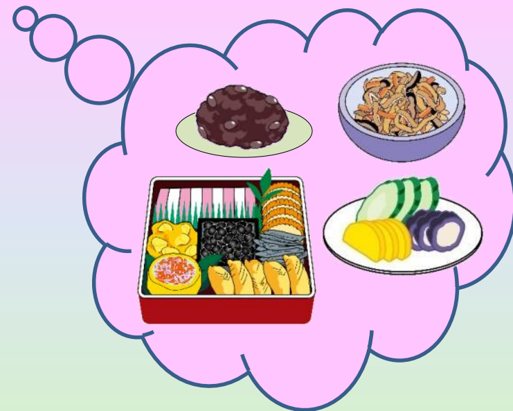
でんとう しょく 伝統食 ぎょうじ しょく 行事食