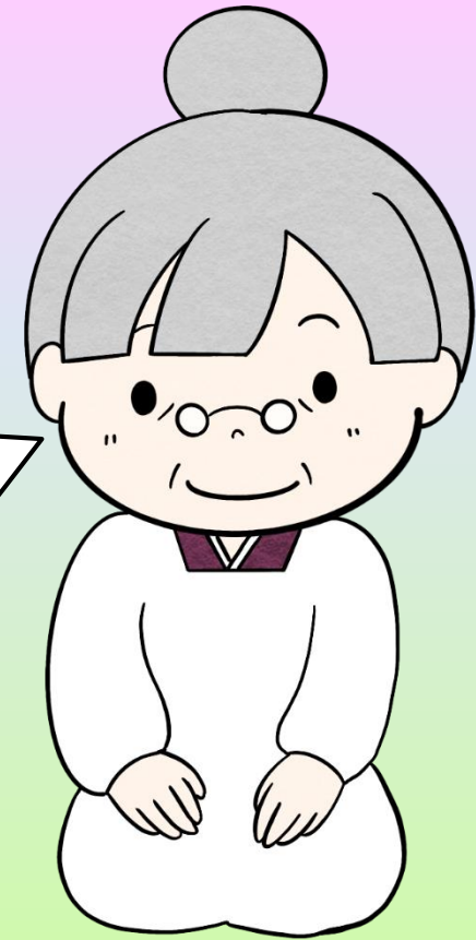
みやこおばあちゃん