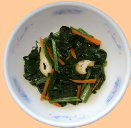
こまつなのびたし