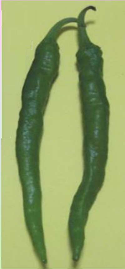
ふしみ 伏見とうがらし