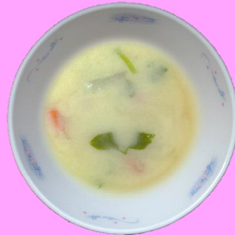
きょうふうみそしる