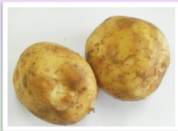
しん 新じゃがいも