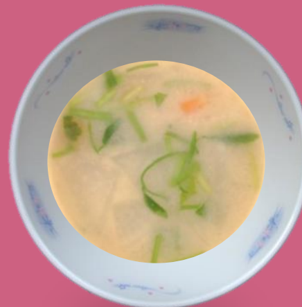
きょうふうみそしる