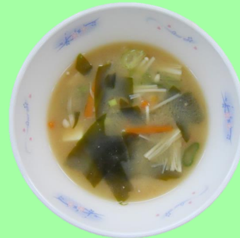
ごしきのみそしる