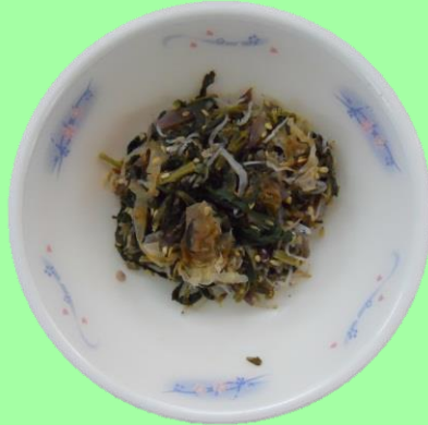
しばづけちりめん