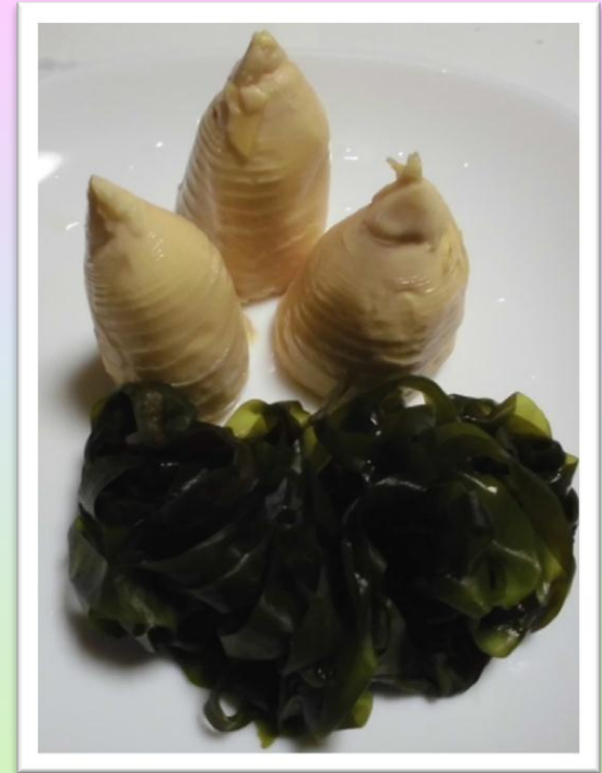
わかめ・たけのこ