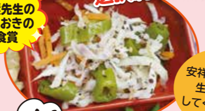
24日 万願寺とうがらしと切干大根の赤しそあえ

京野菜の万願寺とうがらしを切干大根と合わせ、赤しそで味付けするという京都らしさを感じられる献立です。彩も栄養バランスも良く、冷えていてもおいしく食べられるので、給食にぴったりの献立です。