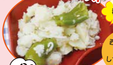
30日 万願寺とうがらしとじゃこポテトサラダ

ビタミンが豊富な京野菜の万願寺とうがらしやカルシウムの豊富なじゃこを組み合わせ考えられました。多くの方に馴染みのあるポテトサラダを和風に仕上げます。それぞれの食材を味わって食べてほしいです。