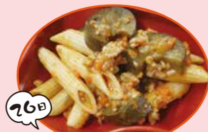
26日 なすのミートソースペシネ

夏にいいなすを使っています。なすが苦手な生徒でも食べてもらえるように、ミートソースと組み合わせています。ぜひ、季節感も味わいながら食べてほしいです。