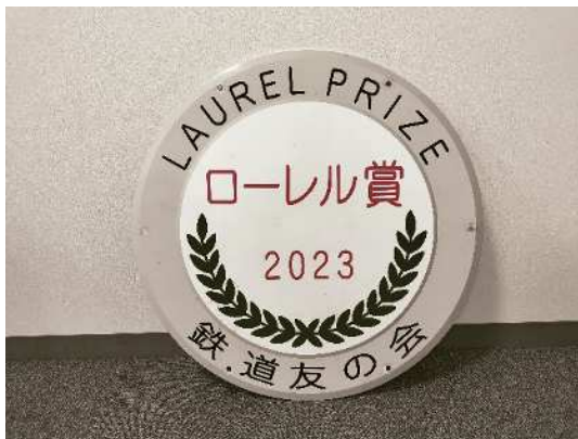
ローレル賞受賞記念ヘッドマーク