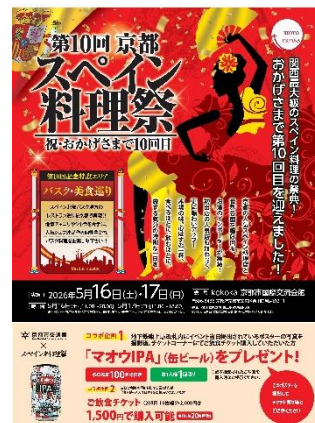
蹴上駅掲出 B1 ポスター