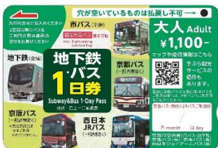
地下鉄・バス1日券