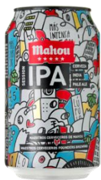
マオウ IPA (缶ビール)