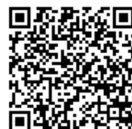
市バス・地下鉄職員の 採用情報メールマガジンの登録