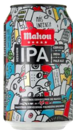
マオウ IPA (缶ビール)