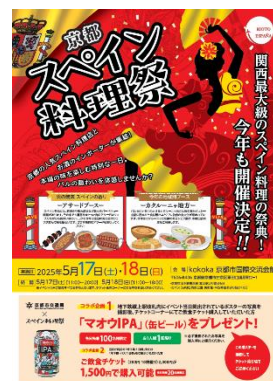
B1ポスターデザイン