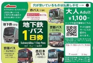
地下鉄・バス1日券