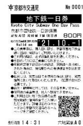
地下鉄1日券 (駅の自動券売機で発売)