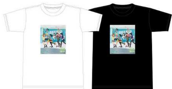
“地下鉄に乗るっ”オリジナルTシャツ