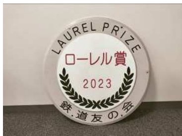
ローレル賞受賞記念ヘッドマーク