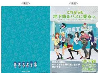
“地下鉄に乗るっ”クリアファイル