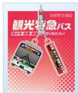
二連キーホルダー(観光特急バス)