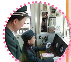
運転体験のイメージ

普段は地下鉄関係職員しか立ち入ることができない研修所の教材室において、地下鉄車両と同サイズの模擬車両を使って運転・車掌シミュレーションをしていただきます。