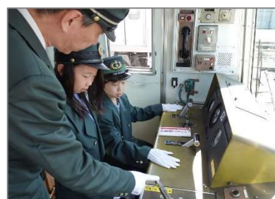
運転体験のイメージ