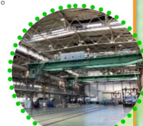
車両基地の整備場