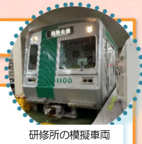
研修所の模擬車両