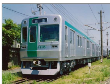
烏丸線車両（10系） （運転車両とは異なる場合があります）

地下鉄の運転に関する事前講習と、模擬車両を使用した運転・車掌シミュレーションの後、車両基地に留置している烏丸線車両（10系）を実際に約500メートル運転していただきます。イベント終了後は、車両基地から竹田駅まで、出庫車両に御乗車いただける特別オプション（無料）も御用意しています。（詳細は別紙のとおり）