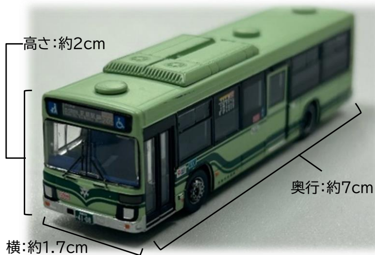
【わたしの街バスコレクションイメージ】