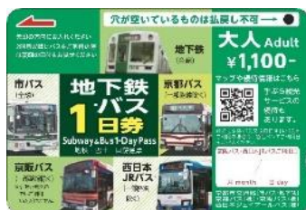
地下鉄・バス1日券